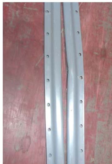
【遭受撞擊測試後的支柱側面】

經過實驗證明英國進口【3D防撞柱】可以在支柱遭受撞擊之後減少支柱受損的程度，一方面減少倉庫內發生公共安全意外的可能；一方面降低倉庫內貨架支柱養護維修的費用，真的是一舉數得。