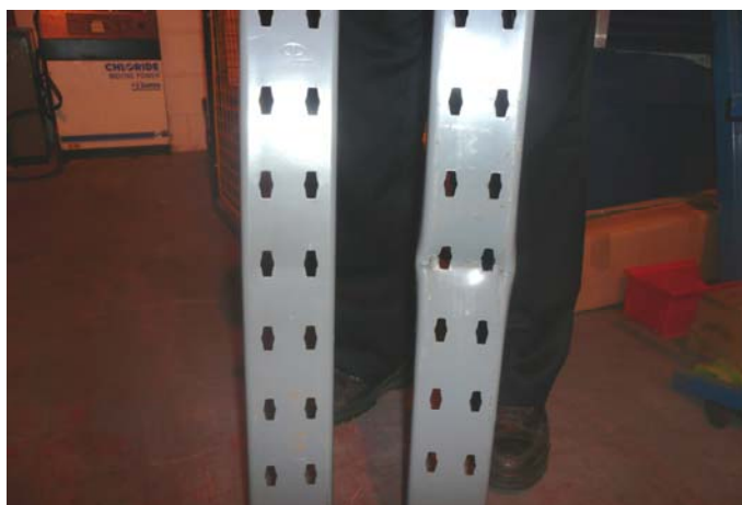
【遭受撞擊測試後的支柱正面】

金屬支柱在未經任何保護的情況下，遭受模擬的堆高機牙叉垂直落下的直接撞擊，支柱已經產生明顯且嚴重的彎曲變形這樣的變形已經在無形中，隱藏工安意外發生的潛在危險。反觀經過【3D防撞柱】保護的金屬支柱幾乎看不到任何的變形及受損，依舊維持原本的功能及安全性。